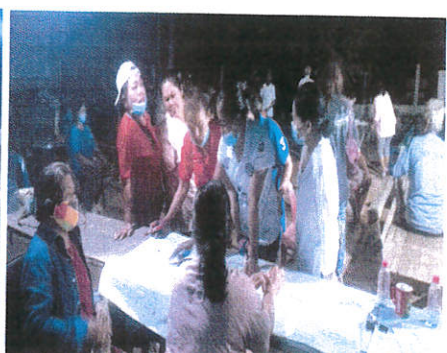
หมู่ที่ ๑๐