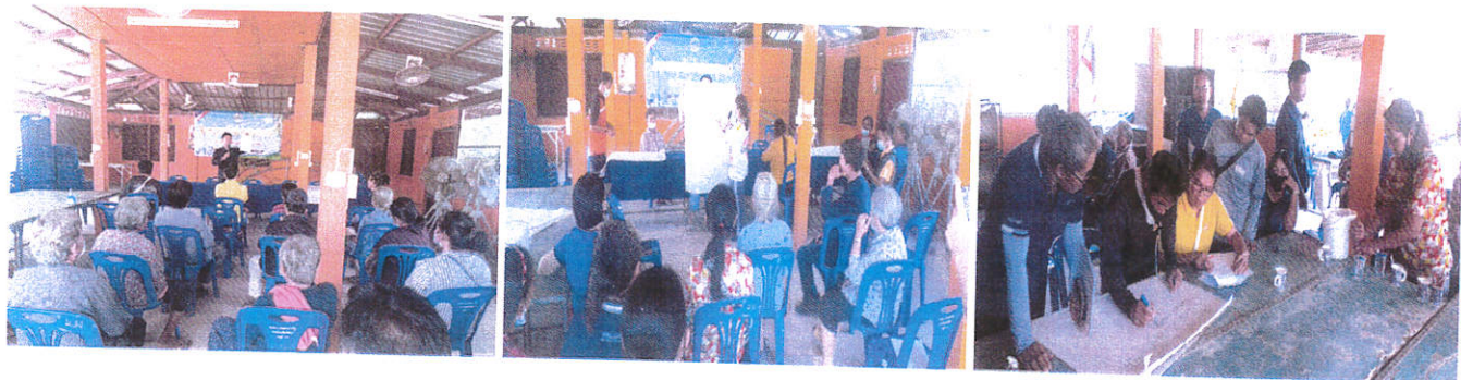
หมู่ที่ ๒