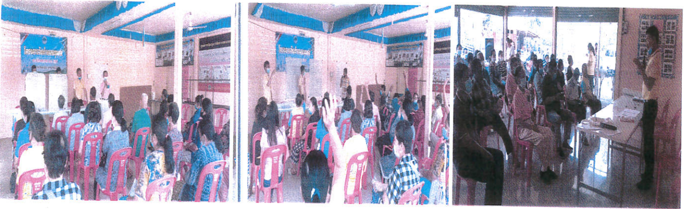
หมู่ที่ ๑๔