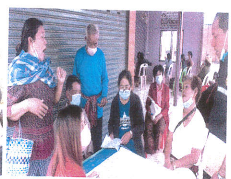
หมู่ที่ ๖