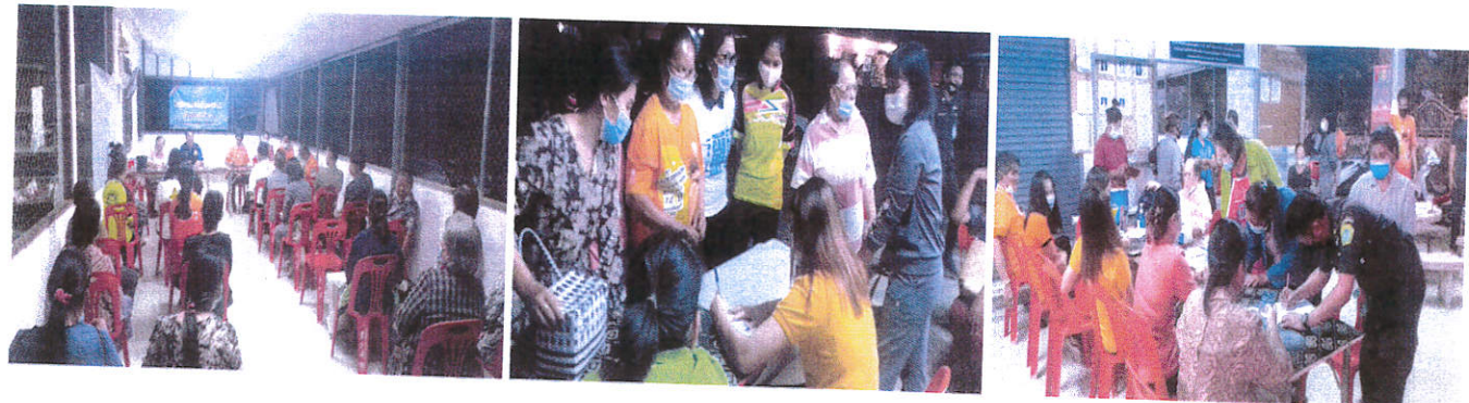
หมู่ที่ ๔