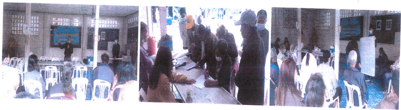
หมู่ที่ ๓