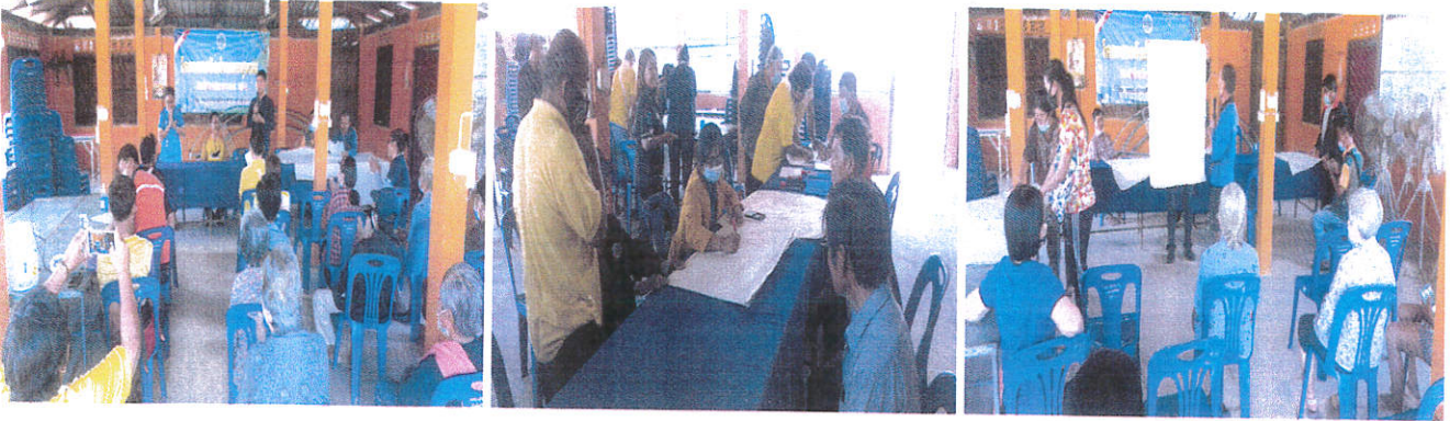
หมู่ที่ ๑๕